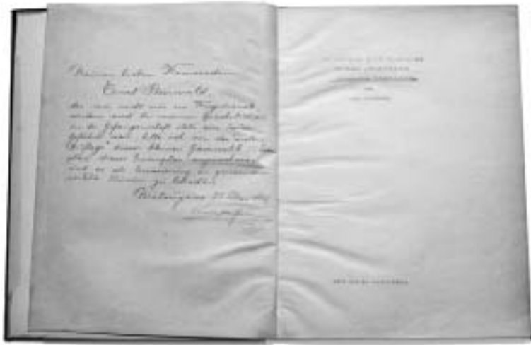
「日本語文語文法」 献呈辞（左）と中表紙