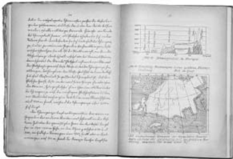
「郷土と父祖の血」の内部ページ