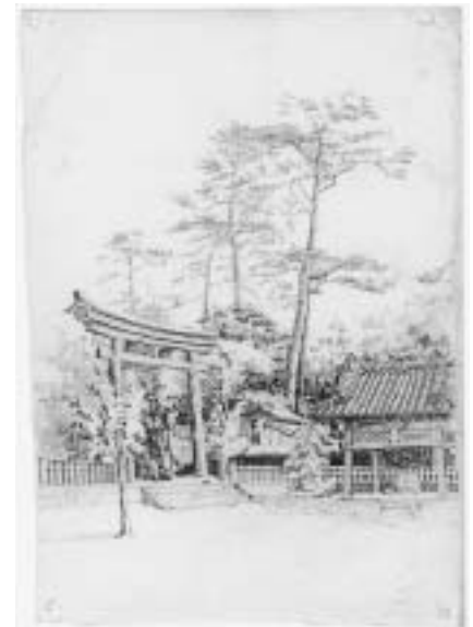
贈呈されたスケッチ画

いうのも、収容所新聞『ディ・バラック』の記事などから1918年3月に板東町内で開催された「俘虜製作品展覧会」に作品を出品していて、線描画の部で一等賞を取っています。さらに、彼の描いた板東周辺のスケッチ画が何枚も『ディ・バラッ