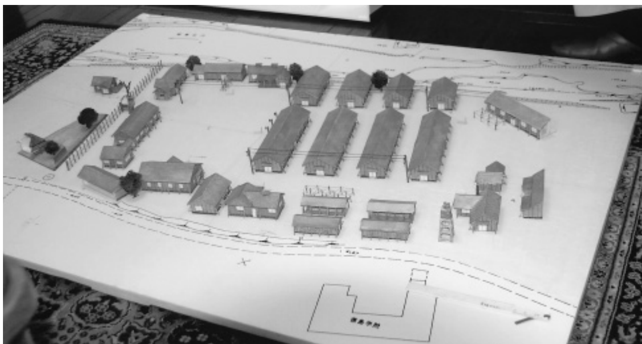
『バルトの楽園』のロケセット