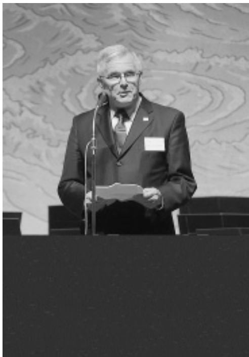
挨拶するツェプターEU大使

なお市内の鳴門高校でも、リュネブルクの姉妹校ラーベ校との交流をふまえて、「鳴校でのドイツ年」と題した講演会が開かれ、館長とヒルシュフェルドがドイツ人気質やドイツの学生生活について話をしました。