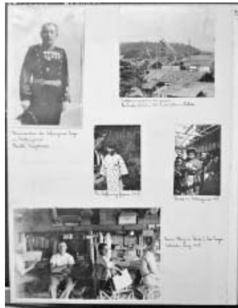
Eine Seite des Albums (Lager Matsuyama)

wurde. Daher finden sich in seinem Fotoalbum Aufnahmen dieser drei Orte. Das Deutsche Haus verfügt bereits über eine große Sammlung von Bildern aus den einzelnen Kriegsgefangenenlagern, an kompletten Alben befanden sich bisher aber nur sechs in unserem Archiv.