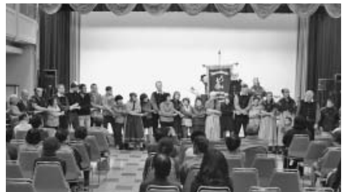
Unsere deutschen Gäste mit dem japanischen Publikum

Die kontrastreiche Veranstaltung endete mit der Möglichkeit des Publikums, sich auch einmal an den grundlegenden Tanzschritten der Ammerländer zu versuchen und die eigene Neugier in einer offenen Fragerunde stillen zu können.