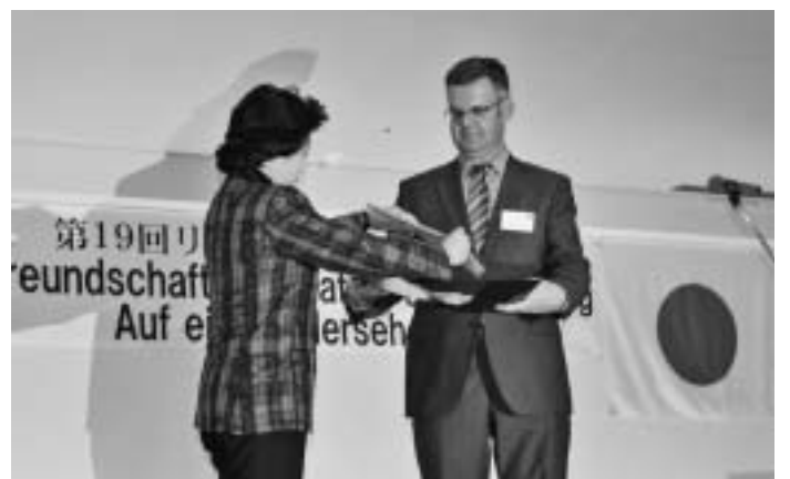
Während des Geschenkaustausches

Während des 18. Besuches der Lüneburger in Naruto, 2010, überreichte die Deutsch-Japanische Gesellschaft zu Lüneburg der Japanisch-Deutschen Freundschaftsgesellschaft Naruto einige