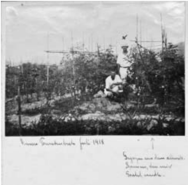
Tomatenbeet (Unten rechts findet sich die Anmerkung über die Herkunft der Samen)