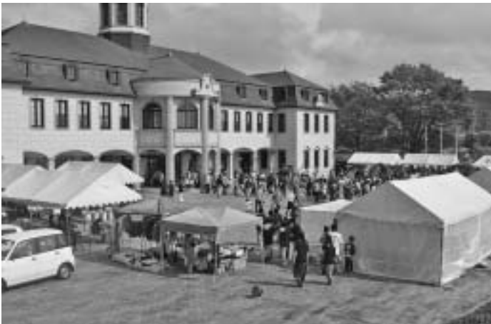
Zahlreiche Besucher befinden sich schon früh morgens vor dem Haus

Zum bereits 19. Mal wurde im vergangenen Jahr am 28. Oktober das Deutsche Fest in Naruto abgehalten. Trotz etwas wechselhaftem Wetter zu Beginn, konnten wir im Laufe des Tages viele Besucher im und vor dem Haus begrüßen. Zum Nachmittag lies sich dann sogar die Sonne vermehrt hinter den Wolken blicken, was die vielen Aussteller auf dem Vorplatz sicherlich freute und dafür sorgte, dass auch ein gewisser Platzmangel bei den Parkplätzen zu drohen schien.