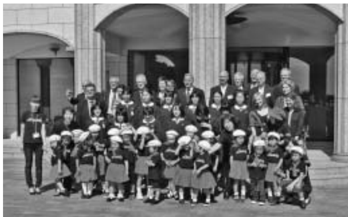
Die Lüneburger Delegation mit Kindern aus Bando (Vor dem Haus)

Noch vor Erreichen des Hauses wurde die Delegation schon während des Besteigens der Treppen von Blasinstrumenten spielenden Grundschulern und die „Ode an die Freude“ singenden Kindergartenkindern empfangen. Die freudig strahlenden Gesichter aller werden mir noch lange in Erinnerung bleiben. Als Erstes stand die Jubiläumszeremonie zu 20 Jahren künstlerischen Austausches zwischen der Lüneburger „Palette“ und dem Kunstverein Naruto auf